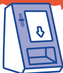
医療機関窓口の顔認証つきカードリーダー

マイナ保険証によるオンライン資格確認で、不正利用防止や医療機関の業務負担軽減にもつながります。医療機関ではマイナ保険証をご利用ください。